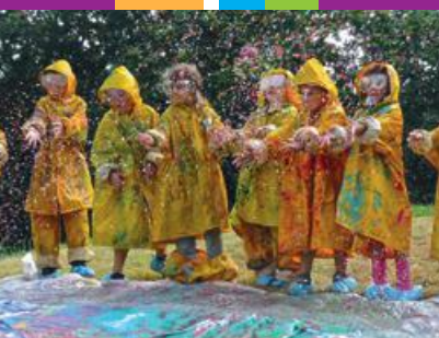
Enfance • Jeunesse