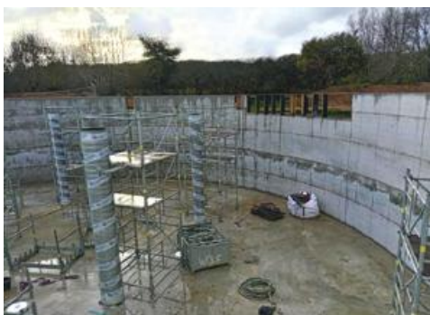
Station d'épuration, avancée des travaux à l'automne 2025