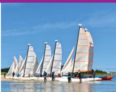
Sports • Loisirs