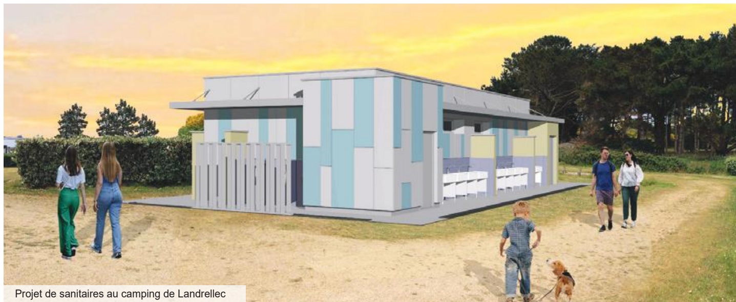
Projet de sanitaires au camping de Landrellec