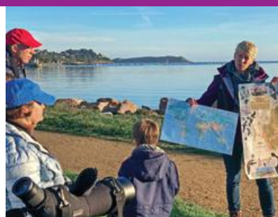
Tourisme • Culture