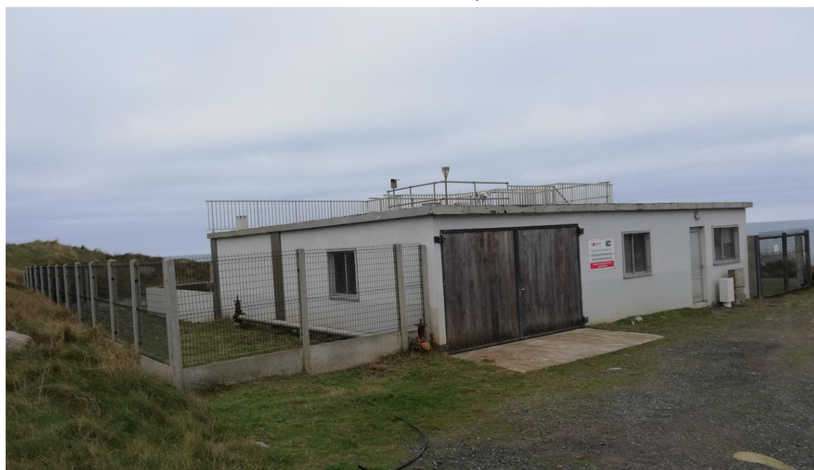
Photo de la station d'épuration