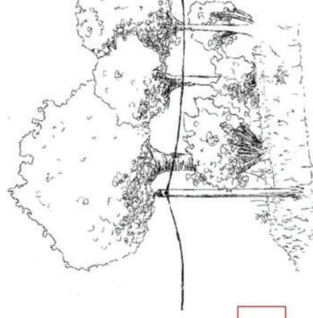
Haut jet + Taillis