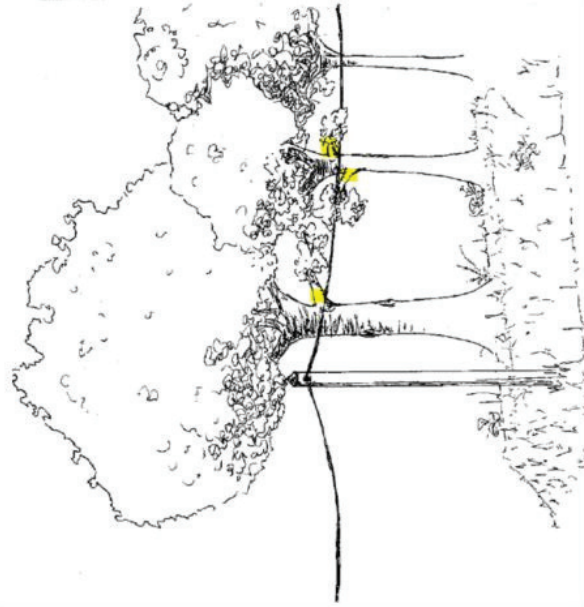
Haies nécessitant un élagage