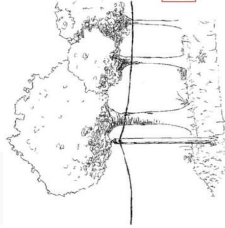
Haut jet / futaie